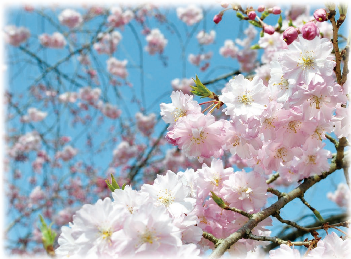
みかも山公園のしだれ桜 (佐野市)