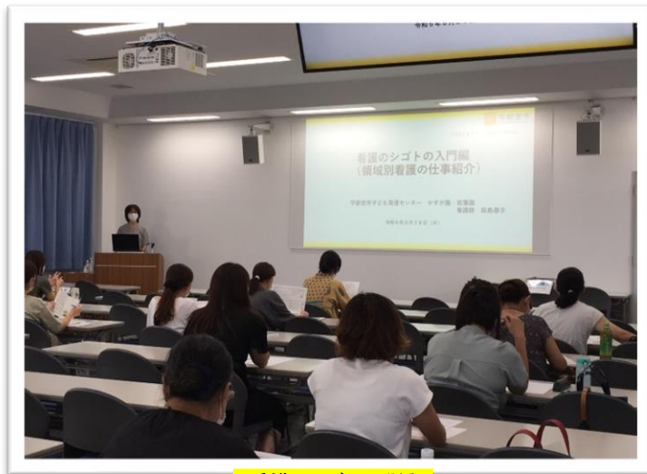
～看護のシゴト入門編～

次回は 11月5日(火) に開催予定です。 皆様のお申し込みを心よりお待ちしております。