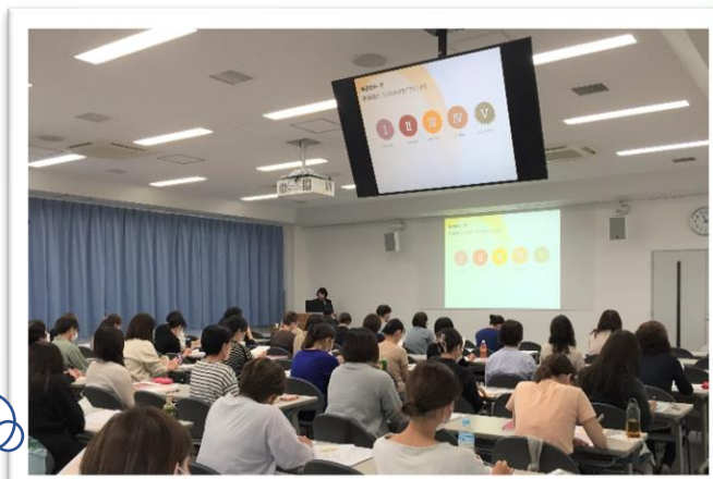
看護職としてのライフプランを考えよう

2級キャリアコンサルティング技能士 の先生からの講義の1コマ♪ 個人ワークを通して、ライフプランに ついて考えます。「良い機会になっ た」とのお声が多く聞かれました。