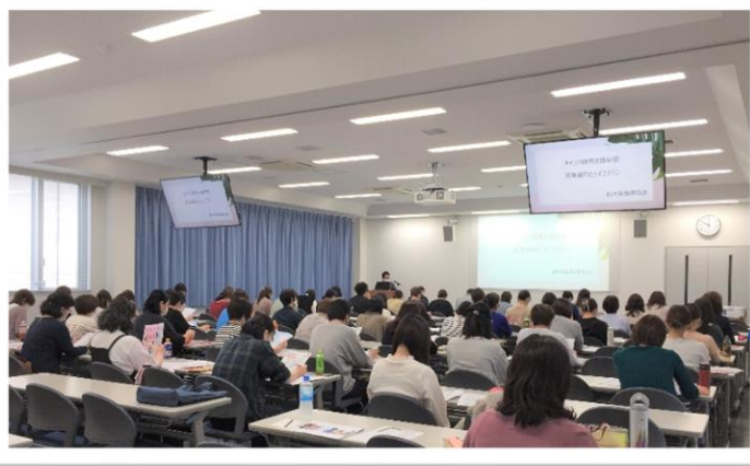
資産運用(新 NISA・iDeCo)とライフプラン

「看護職としてのライフプランを考えよう」は、 次回1/24(金)開催予定 です。 皆様のお申し込みを心よりお待ちしております。