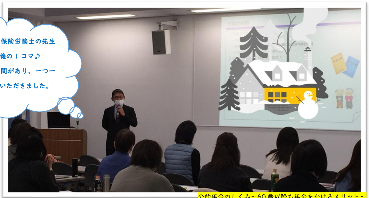
公的年金のしくみ～60歳以降も年金をかけるメリット～

特定社会保険労務士の先生 からの講義の1コマ♪ 沢山の質問があり、一つ一つ お答えいただきました。