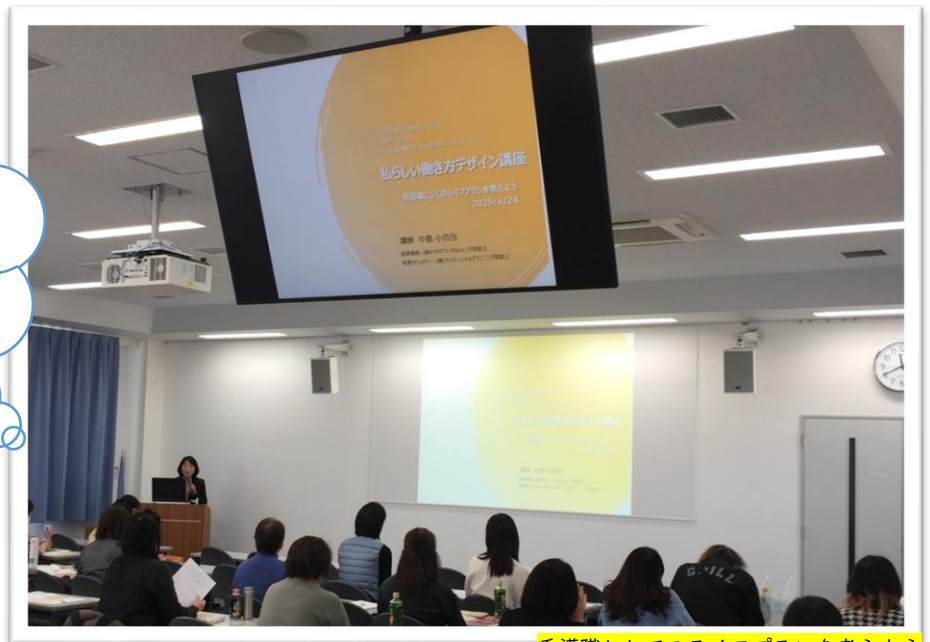
看護職としてのライフプランを考えよう

2級キャリアコンサルティング 技能士の先生からの講義の1コ マ♪ 個人ワークを通して、ライフプ ランについて考えます。