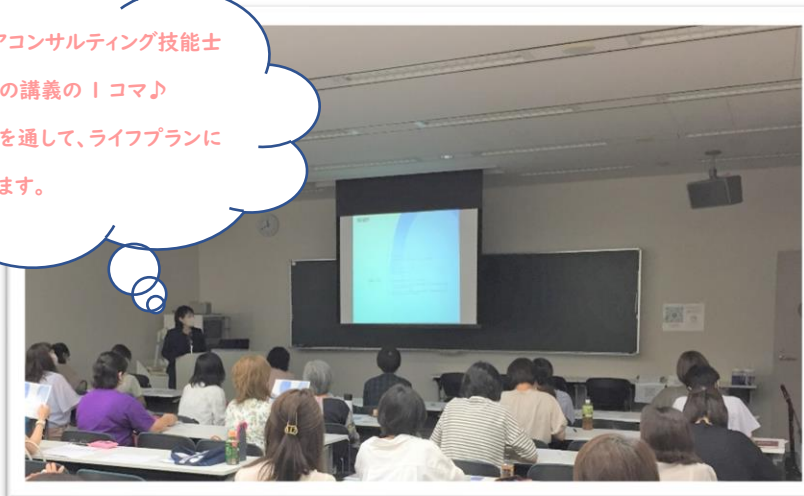
看護職としてのライフプランを考えよう

2級キャリアコンサルティング技能士 の先生からの講義の「コマ」 個人ワークを通して、ライフプランに ついて考えます。